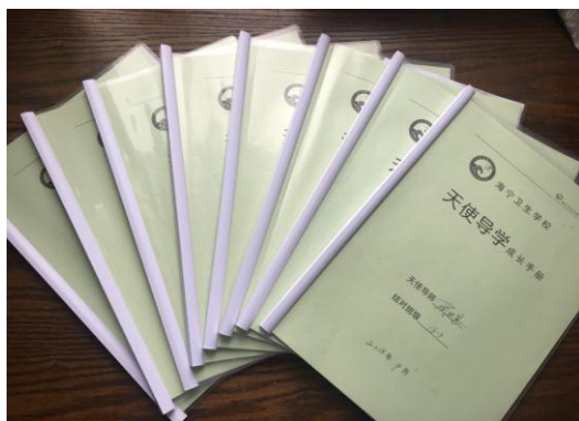
图 4：天使导学成长手册