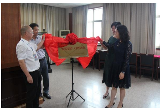
图 2：现代学徒制培养签约授牌

“现代学徒制试点”教学改革，改变了传统的教育教学模式，实现了产教真正融合。学校和医院双方优势互补，学生学习热情学习效率非常高，教学质量显著提高。