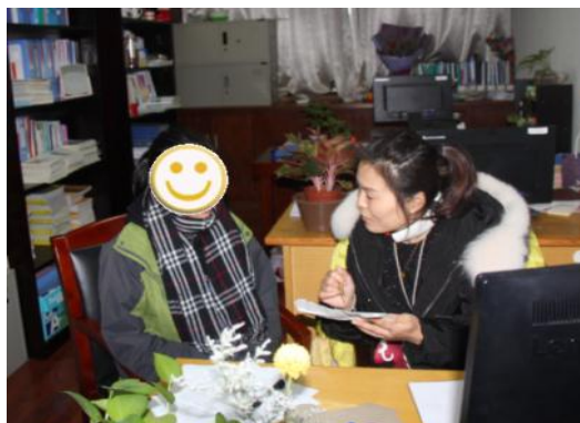
图 5：一对一精准导学