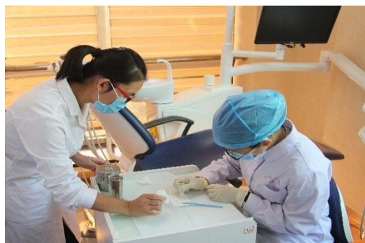
图 3：师徒一对一技能教学